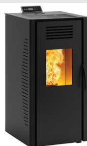
nero cod. 7241047900I