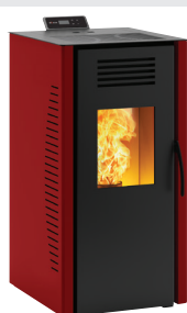
rosso cod. 7241047905I