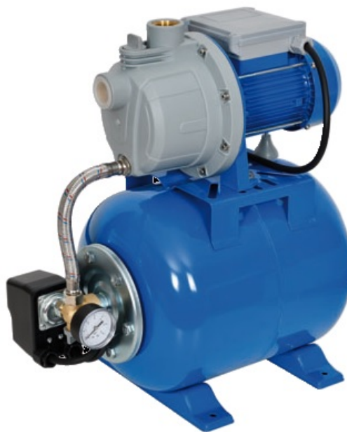
PRS19JET41P / 512656