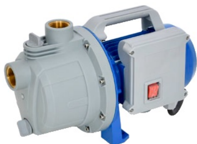
PRJET41P / 512646